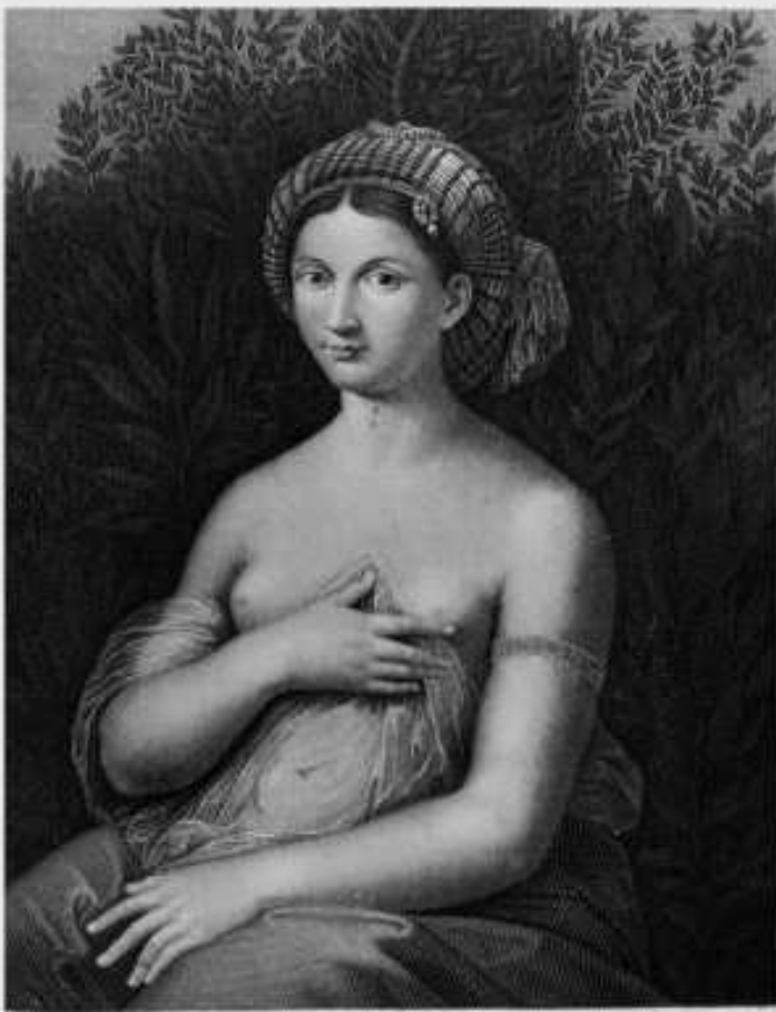
LA FORNARINA DI RAFFAELLE